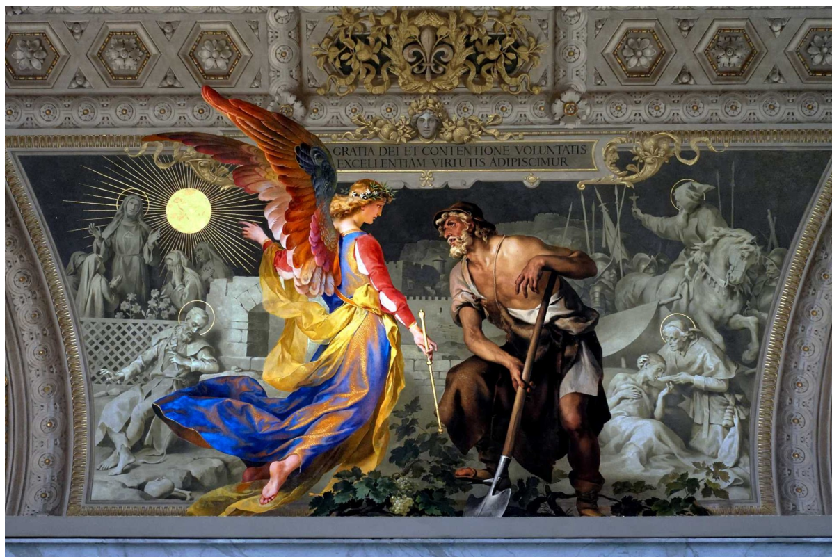
Museo Clementino del Vaticano.